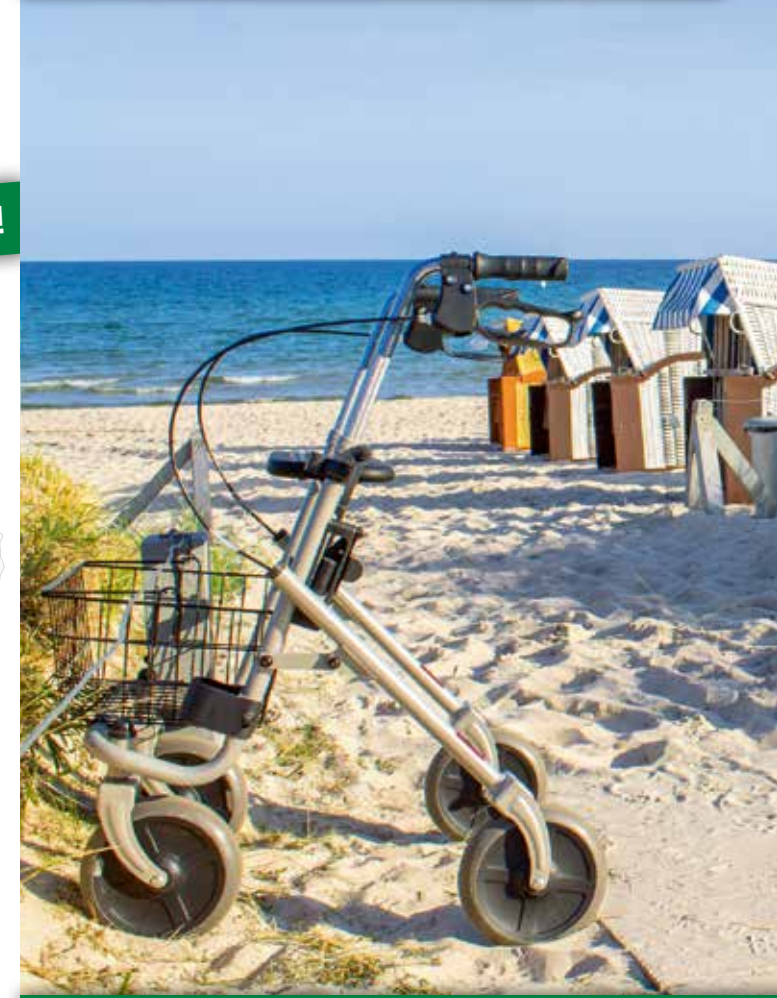
Stand 06/2017